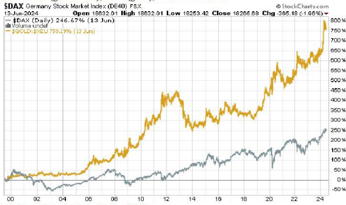
Gold in Euro (goldfarben), DAX (grau), 1999 bis 13.6.2024